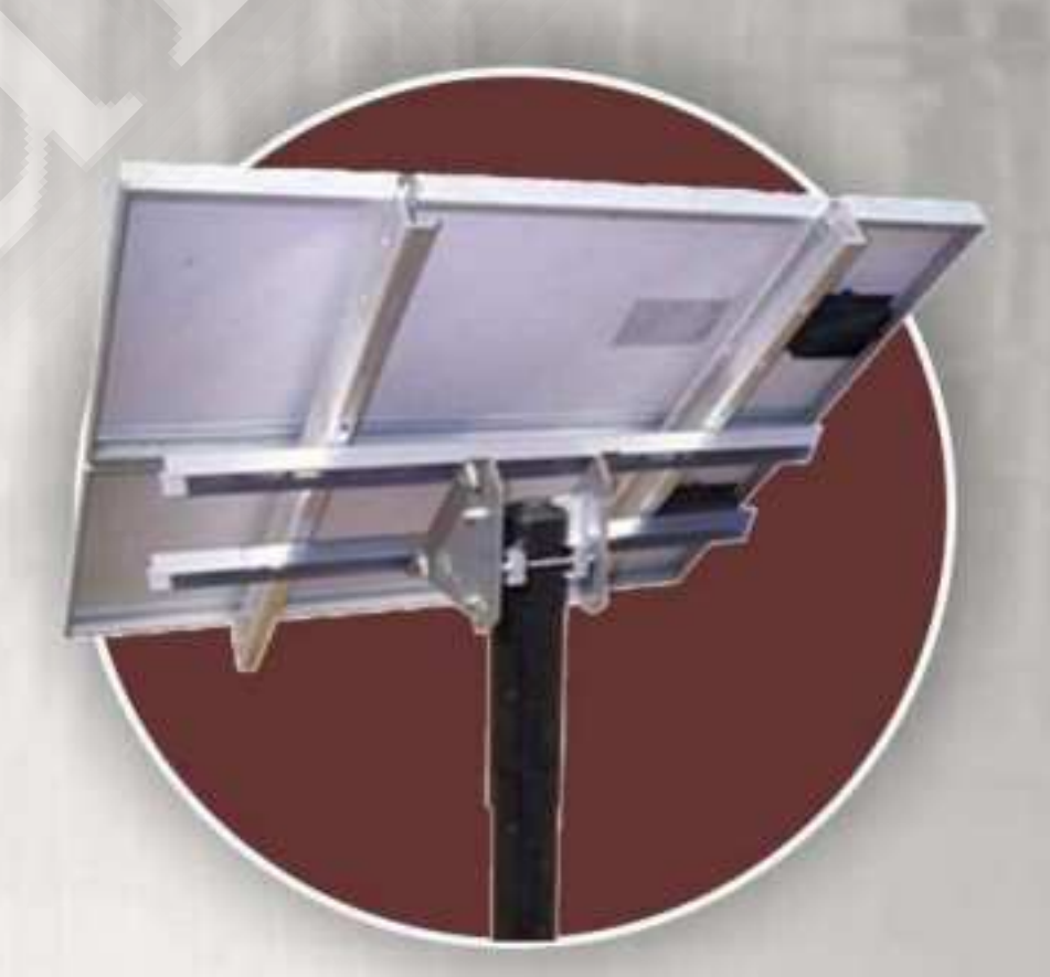
Bracket Modul Surya