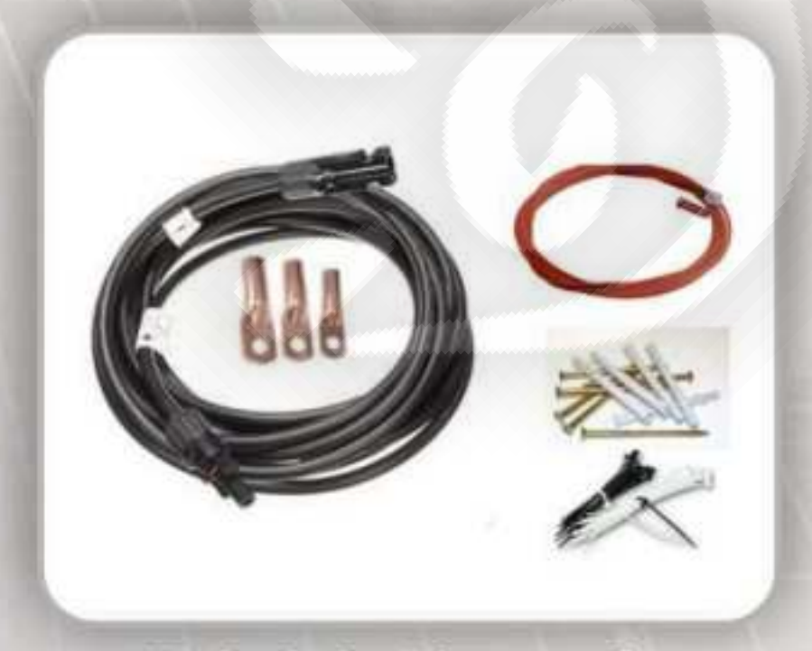
Kabel & Aksesoris